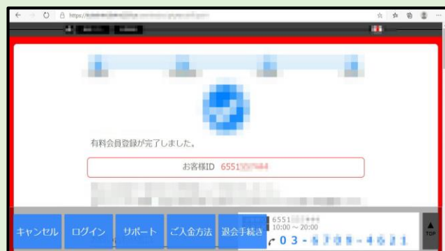
有料会員登録完了の画面が