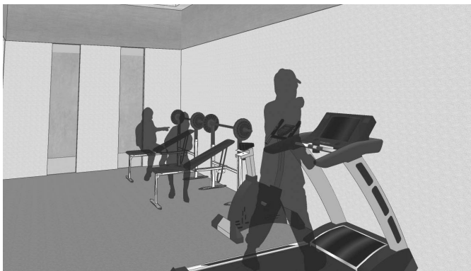
体力錬成消防訓練室(1階)