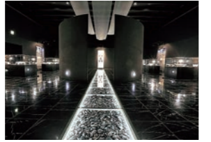
幻想的な雰囲気にもまれた「黒曜石ギャラリー」

2023年6月27日の官報号外第134号の告示により遠軽町所蔵の『北海道白滝遺跡群出土品』が国宝に指定された。白滝遺跡群で発掘された出土品は旧石器時代の石器や接合資料など1965点におよび、歴史的価値が改めて評価された形だ。道内の国宝は函館市の中空土偶に次ぐ2例目となる。メディアでも話題の出土品は、遠軽町埋蔵文化財センター(→P5)で見ることができる。