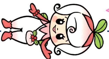
白滝ジョッキー こけもも姫