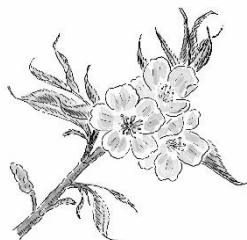
遠軽町の木 エゾヤマザクラ

令和元年度は、森林環境譲与税が収入されたことにより、2258万円を積み立て、103万円を取り崩しました。