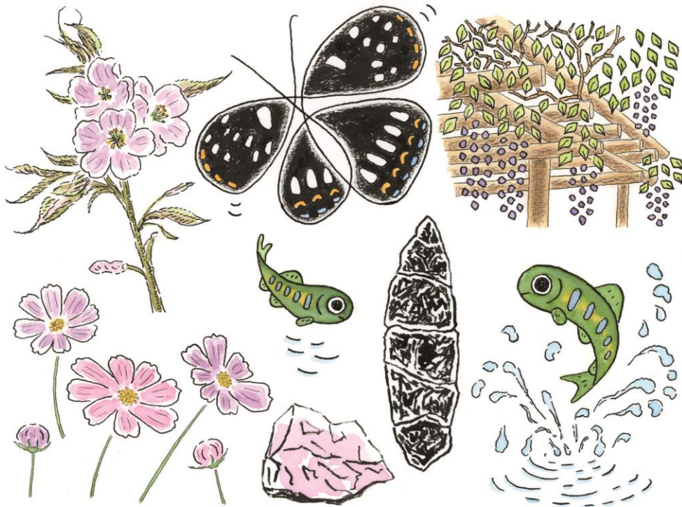
遠軽町の花・木・石・魚・蝶