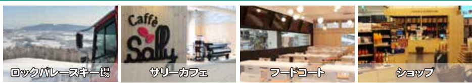
ロックパレススキー場