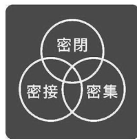
3つの「密」をさけよう