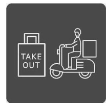
テイクアウトやデリバリーも