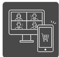
オンラインを上手に使おう