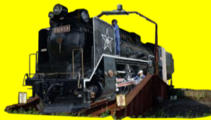
SLを転車台に載せたイメージ