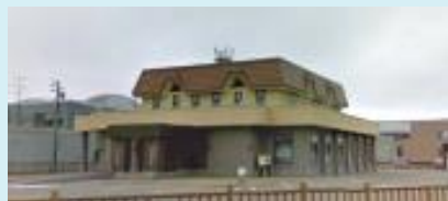
旧地ビールレストランふぁーらいとの改修