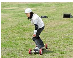
マウンテンバイク(山頂まで運搬可能) マウンテンボード