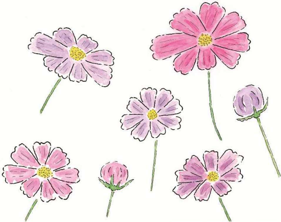
遠軽町の花 コスモス