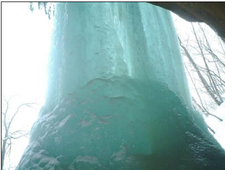
「山彦の滝(裏見の滝)」が氷結した様子